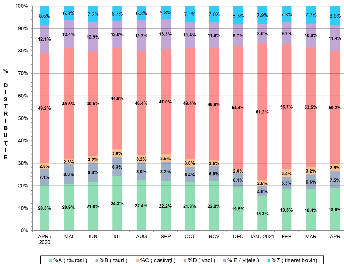
FLUCTUAȚIA LUNARĂ A DISTRIBUȚIEI CATEGORIILOR DE CARCASE CLASIFICATE