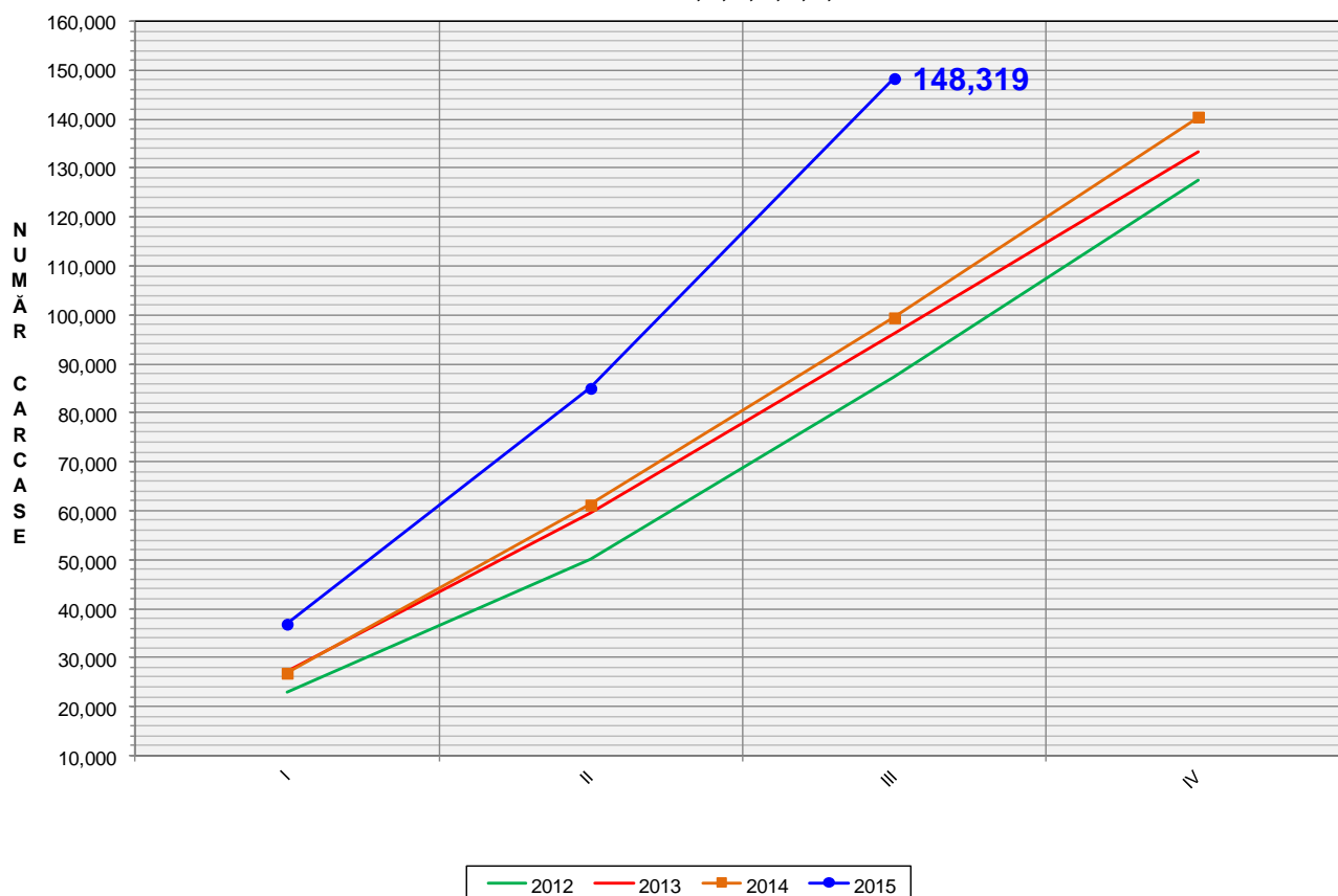
EVOLUȚIA TRIMESTRIALĂ CUMULATIVĂ A NUMĂRULUI DE CARCASE DE BOVINE CLASIFICATE CATEGORIILE: A, B, C, D, E, V, Z